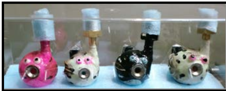
フグ子 フグ丸 フグ吉 フグ之助